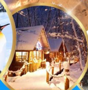
หมู่บ้านเทพนิยาย นิงเกิ้ลเทอเรส