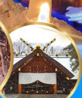
ศาลเจ้า ออกโทโต

เดินทาง 04 - 09 กุมภาพันธ์ 68 05 - 10 กุมภาพันธ์ 68