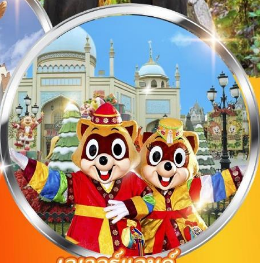
เอเวอร์แลนด์