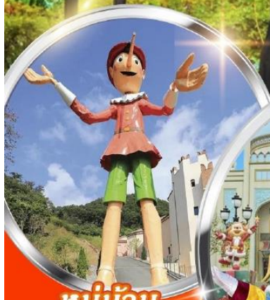
หมู่บ้าน ฝรั่งเศส