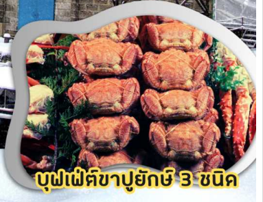
บุฟเฟ่ต์ขาปูยักษ์ 3 ชนิด

บิน Full service สายการบินไทย น้ำหนักกระเป๋า 25 กก. **เที่ยวเต็มทุกวัน อาหารครบทุกมื้อ**