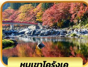
หุบเขาโคริงเค