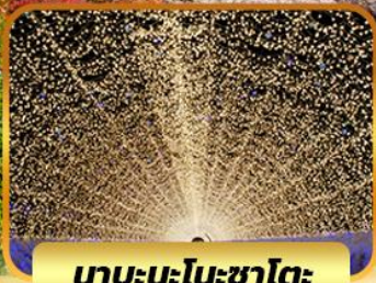
นาคะนะโนะซาโตะ