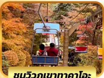
ชมวิวกูเขากาตาโอะ