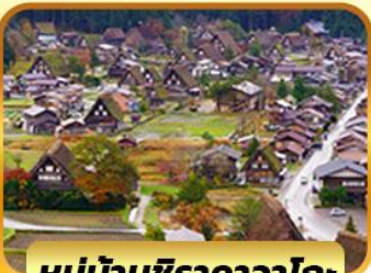
หมู่บ้านชิราคาวาโกะ