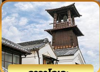
คาวาโกเอะ