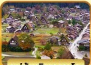
หมู่บ้านชิราคาวาโกะ