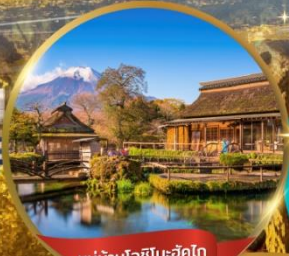
หมู่บ้านโอชิโนะฮักโก