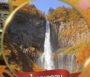
น้ำตกเคทงอน