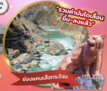
"รวมค่าบันไดเลื่อน ขึ้น-ลงแล้ว"