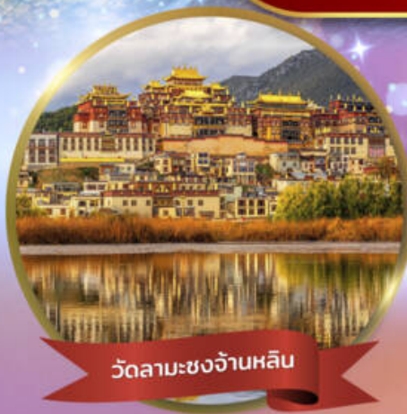
วัดลามะชงจ้านหลิน