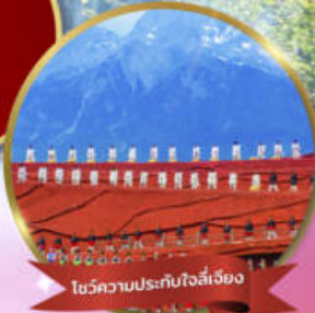
โชว์ความประทับใจลี่เจียง