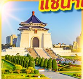
อนุสรณ์เจียงไคเช็ค

นั่งรถไฟปองปอง! ชมวิวที่ผิงซาน แช่น้ำแร่ร้อนตัวในห้องพัก