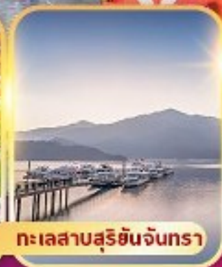
ทะเลสาบสุริยันจันทรา