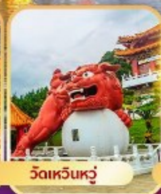
วัดเหวินหวู่