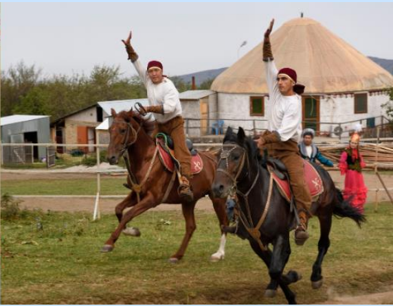
จากนั้น นำท่าน