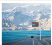
ทะเลสาบไ่ซาหู่