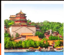
อวิ๋หอหยวน