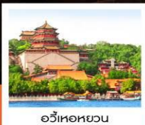
อวิ๋เหอหยวน