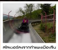
สลิเดอร์ลงจากกำแพงเมืองจีน