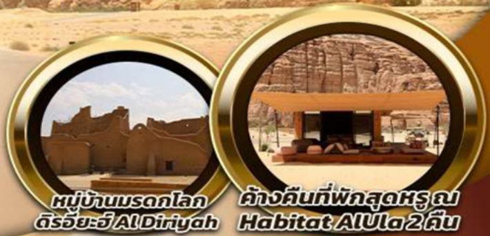
หมู่บ้านมรดกโลก ดิริยาฮ์ AlDiriyah