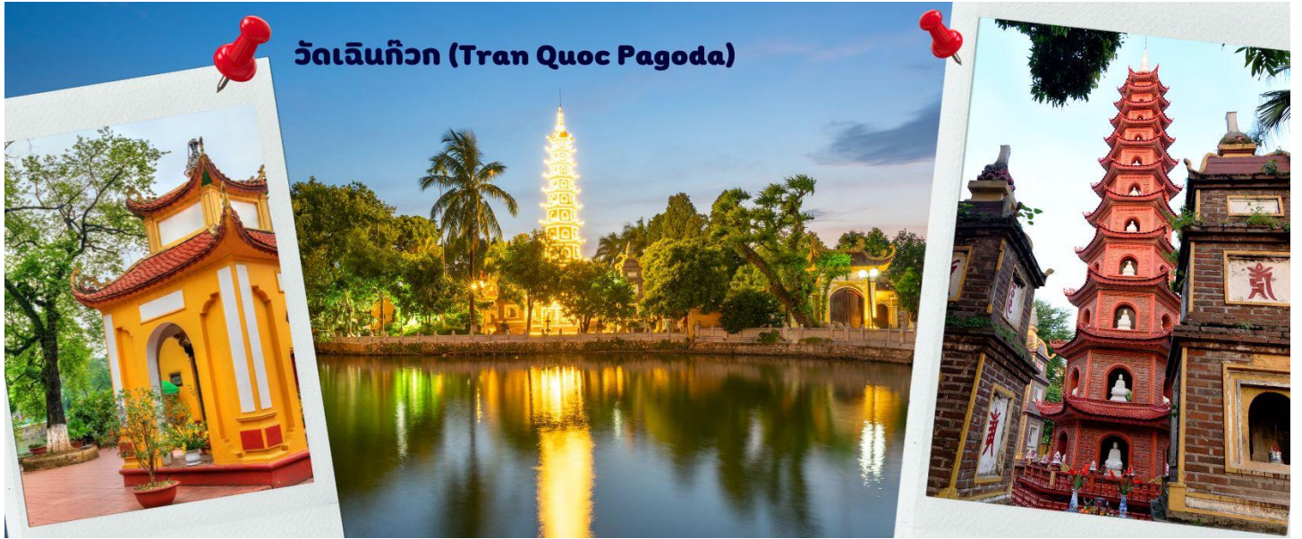
วัดเงินทิว (Tran Quoc Pagoda)

พระพุทธศาสนา จากภาพมุมสูงของสถานที่ตั้ง ที่นี่เหมือนตั้งอยู่บนเกาะที่ยื่นลงไปในทะเลสาบ แต่มีเส้นทางคมนาคมเข้าถึงที่ สิ่งปลูกสร้างมีการวางผังเป็นอย่างดี ใช้สีสันทึกลมกลืนในโทนสีเหลือง น้ำตาล ตัดกับสีเขียวของต้นไม้ใหญ่ที่โอบล้อมอยู่ ในมุมถ่ายภาพจากอีกฝั่งหนึ่ง จะเห็นสิ่งปลูกสร้างสไตล์จีน และเจดีย์หลายชั้นโดดเด่น มีภาพที่สะท้อนลงสู่ผิวน้ำ เป็นภูมิทัศน์ที่งดงามทั้งยามกลางวันและยามค่ำคืนที่มีการเปิดไฟส่องสว่าง