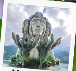
Moana Cafe Sapa