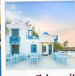
ซานตารีนาคาเฟ่