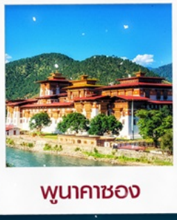
พูนาคาซอง