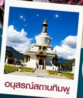
อนุสรณ์สถานทิมพู