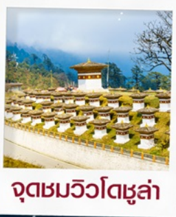
จุดชมวิวโดซูล่า

พิชิตยอดเขาวัดทักซัง พลังศรัทธาของชาวพุทธ เที่ยวครบ เมืองพาโร ทิมพู พูนาคา