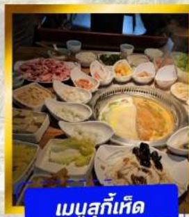
เมนูสุกี้เด็ด