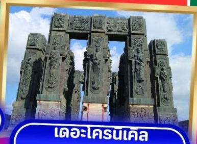
เดอะโครนเคิล ออฟ จอร์เจีย

พิเศษ.. ทดลองชิมไวน์ 3 ชนิด ต้นตำรับของจอร์เจีย