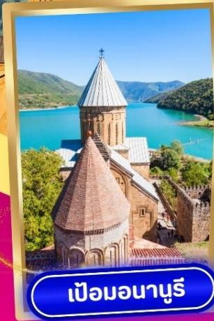
เป็อมอนาบุรี