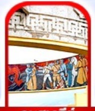
อนุสาวรีย์ โซซาน