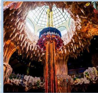
สวนสนุก Fantasy Park