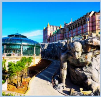
โซอู Eclipse Square