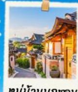
หมู่บ้านนูกซอน