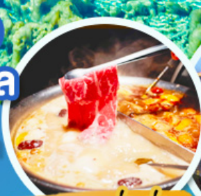
ชาบูหม่าล่า