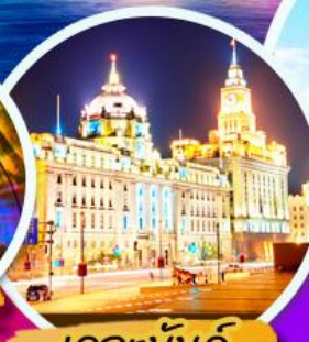
เดอะบันด์