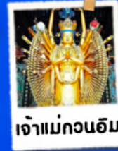
เจ้าแม่กวนอิม