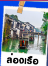
ล่องเรือ