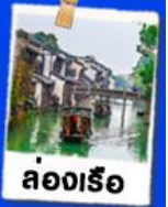
ล่องเรือ