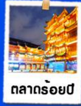
ตลาดร้อยปี