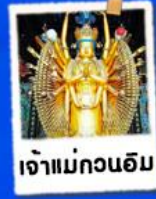
เจ้าแม่กวนอิม