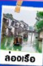
ล่องเรือ