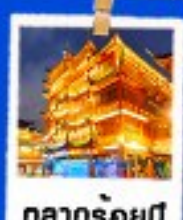
ตลาดร้อยปี