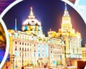
เดอะบันด์