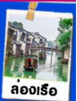
ล่องเรือ