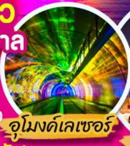
อูโมงค์เลเซอร์