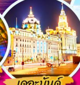
เดอะบันด์