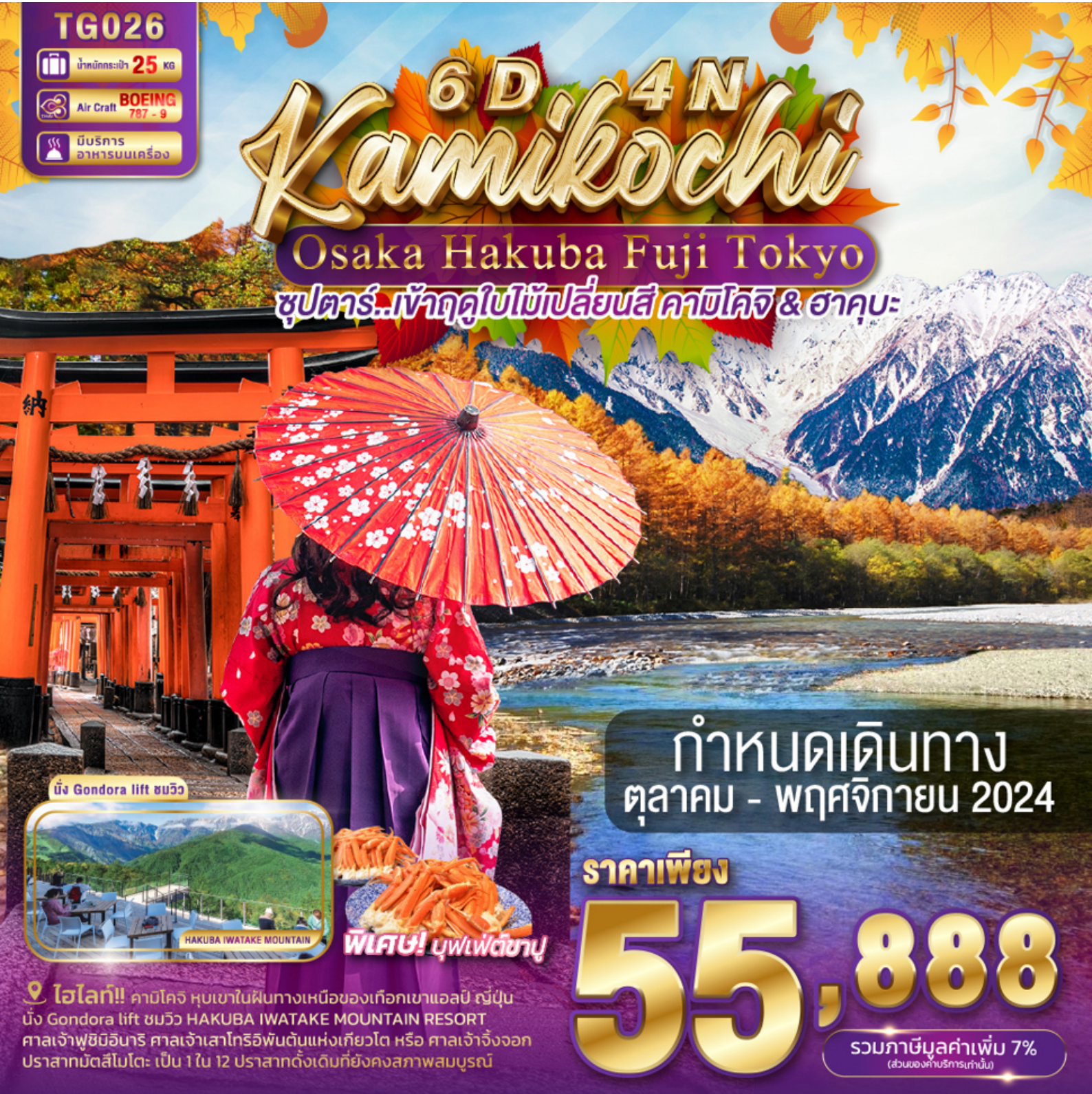
นั่ง Gondora lift ชมวิว

ซูปรคาร์..เจ้าฤดูใบไม้เปลี่ยนสี คามิโคจิ & ฮาคุบะ