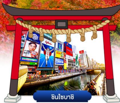
ชินโซบาชิ