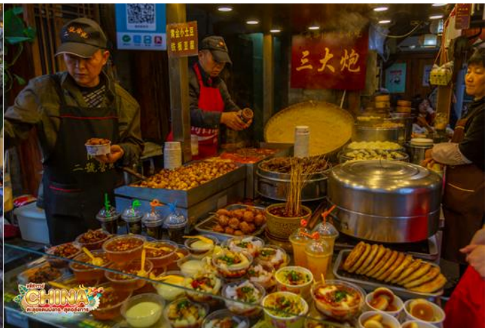
** อิสระอาหารเย็นตามอัธยาศัย เพื่อความสะดวกในการช้อปปิ้ง **

ที่พัก พักที่ SERENGETI HOTEL หรือระดับเทียบเท่า ★★★★★