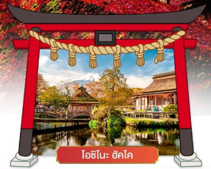
โอชิโนะ ฮักโค

เดินทางโดยสายการบิน : ไทยแอร์เอเชียเอ็กซ์