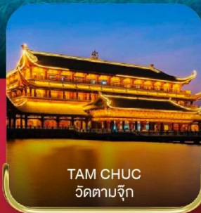
TAM CHUC วัดตามจึก