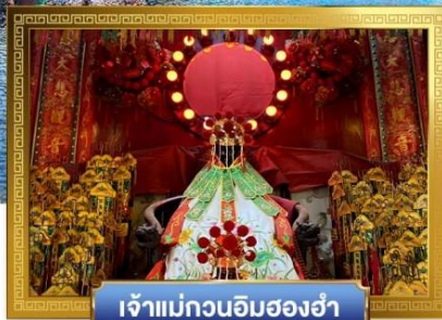
เจ้าแม่กวนอิมฮ่องฮ้า