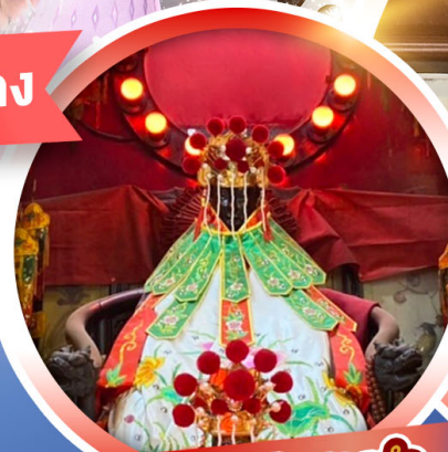
เจ้าแม่กวนอิมองค์