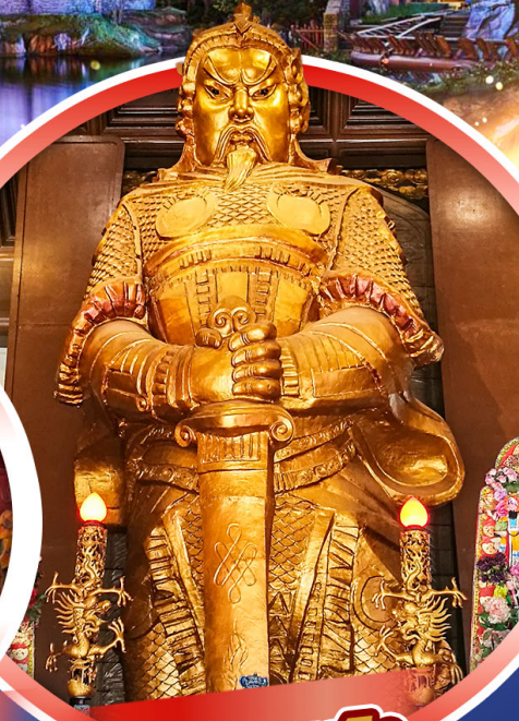
วัดเขกงทมือ