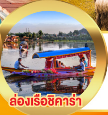
ล่องเรือซิคาร์่า