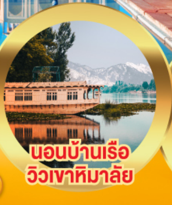
นอนบ้านเรือ วิวเขาหิมาลัย