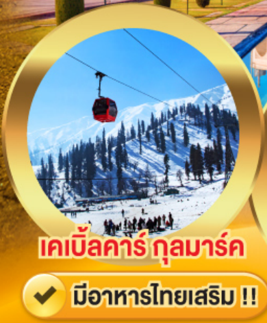
เคเบิลคาร์ กุลมาร์ค