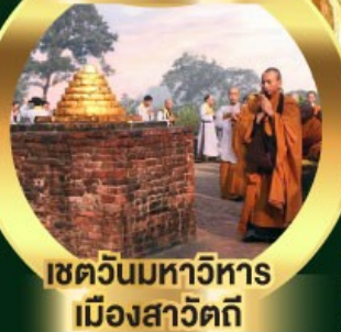
เซตวันมหาวิหาร เมืองสาวัตถี