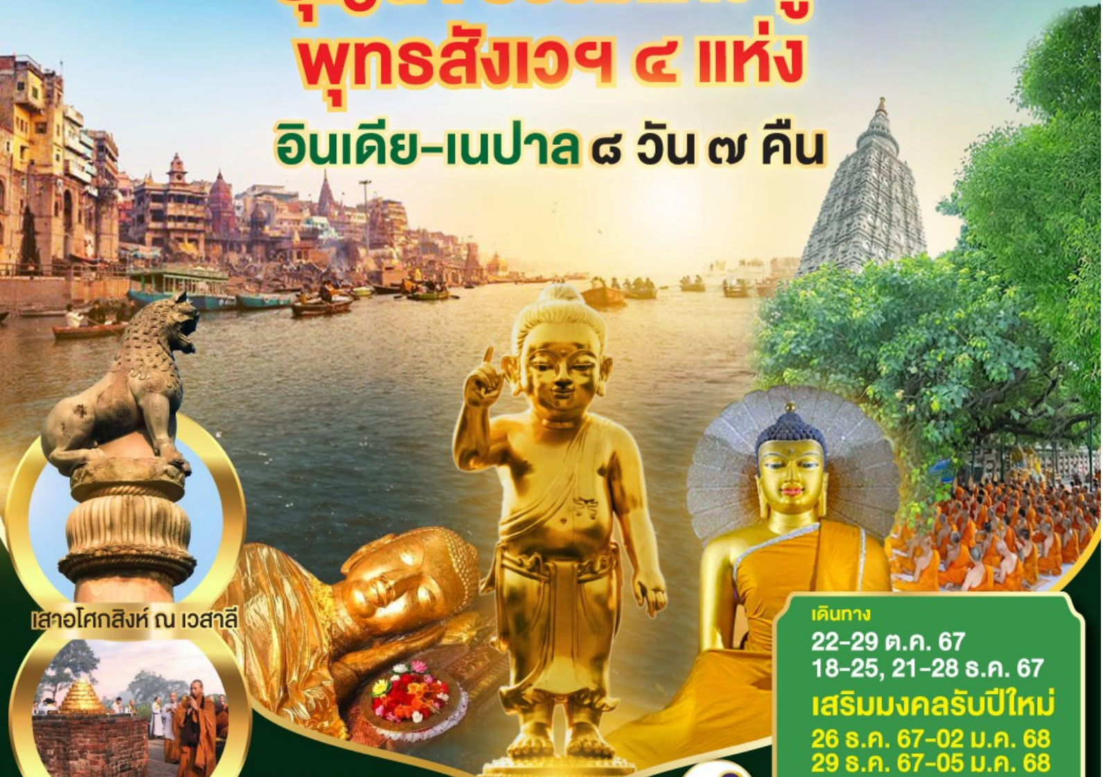
เสาอโศกสิงห์ ณ เวสาลี