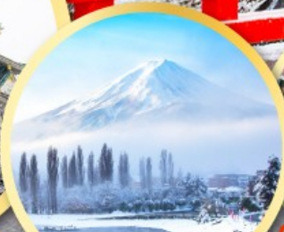
ทะเลสาบคาวากุจิโกะ