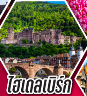
ไฮเดลเบิร์ก