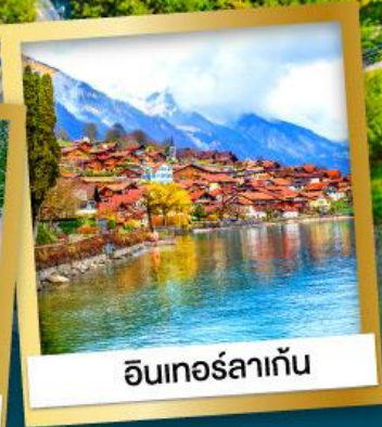
อินเทอร์ลาเก้น