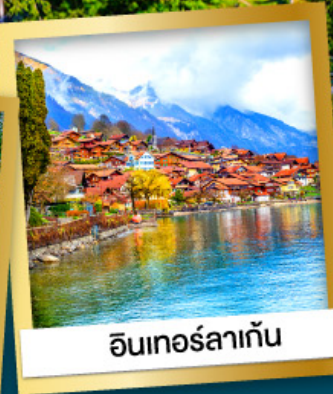
อินเทอร์ลาเก้น