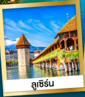
ลูเซิร์น