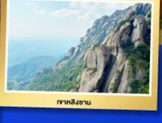
เขาหลิงซาน