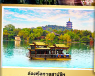
ล่องเรือทะเลสาบซีหู