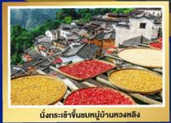
นั่งกระเช้าขึ้นชมหมู่บ้านหวงหลิง