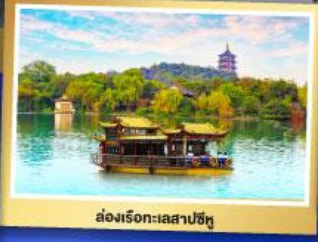
ล่องเรือทะเลสาปซีหู