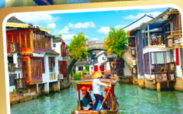
ล่องเรือเมืองโบราณซูโจวเจียเจียว