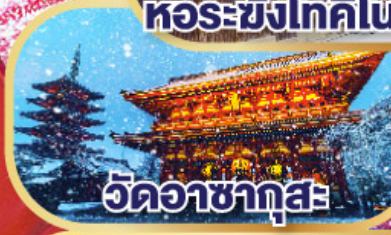
วดอชาทุสะ