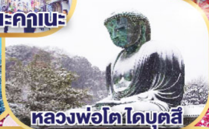
หลวงพ้อโตโดบตุลล