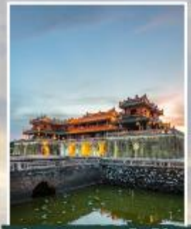
เว้ พระราชวังไถ่ไน่ย์