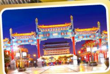
ถนนโบราณเทียนเหมิน