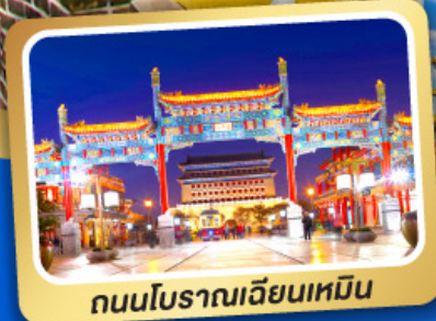
ถนนโบราณเทียนเหมิน