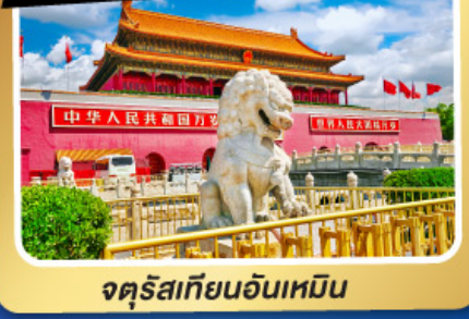
จตุรัสเทียนอันเหมิน