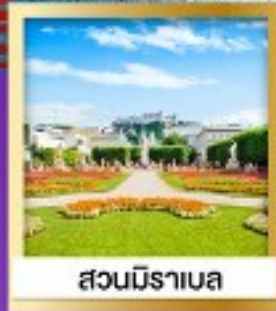
สวนมิราเบล