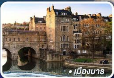
● เมืองบาส

● ถ่ายรูปสนามฟุตบอลแอนฟิลด์ สนามฟุตบอลโอลด์แทรฟฟอร์ด