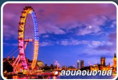
● ลอนดอนอายส์

● บินลงแมนเชสเตอร์ กลับที่ลอนดอน ไม่ย้อนเส้นทาง