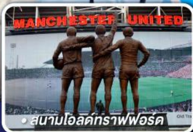
● สนามโอลด์แทรฟฟอร์ด