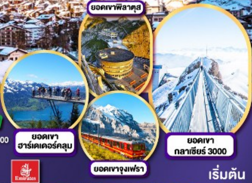
ยอดเขาฟีลาตุส