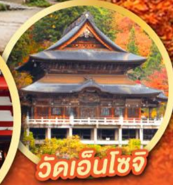
วัดเอ็นโซจิ

กิจกรรมเก็บผลไม้ พักออนเซ็น 2 คืน พักโรงแรมในโตเกียว 2 คืน