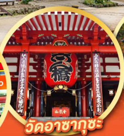
วัดอาซากุสะ