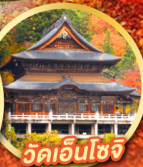
วัดเอ็นโซจิ

กิจกรรมเก็บผลไม้ พักออนเซ็น 2 คืน พักโรงแรมในโตเกียว 2 คืน