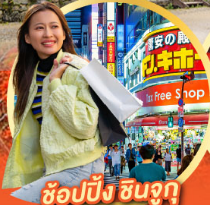
ช้อปปิ้ง ซินจูกุ

นั่งกระเช้าชมวิว ใบไม้เปลี่ยนสี Mt. Adatara