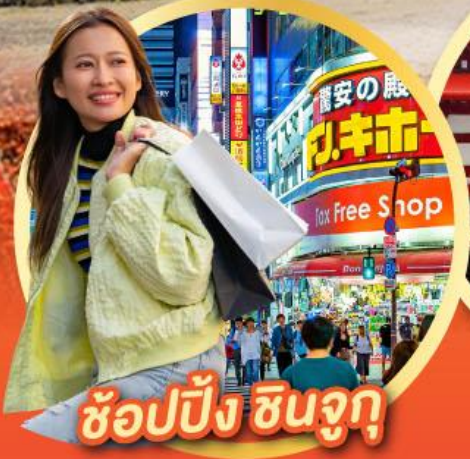
ช้อปปิ้ง ซินจุกุ

นั่งกระเช้าชมวิว ใบไม้เปลี่ยนสี Mt. Adatara