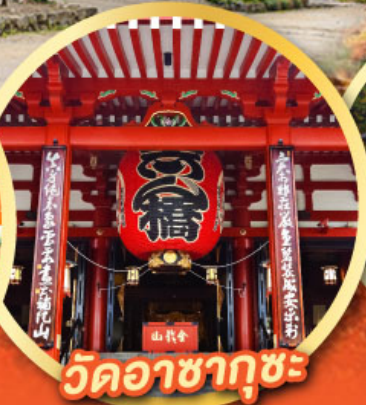
วัดอาซากุสะ