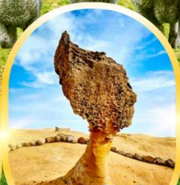
อุทยานแห่งชาติ เย่หลิว