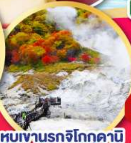
หุบเขานรกจิทอกุดานิ