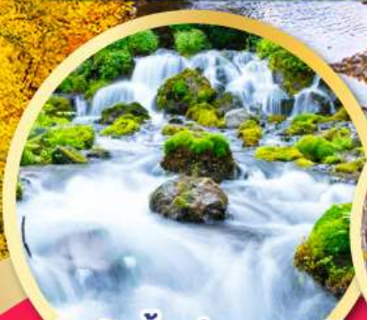
สัมผัสน้ำแร่ธรรมชาติ ณ สวนฟูทาคาชิ