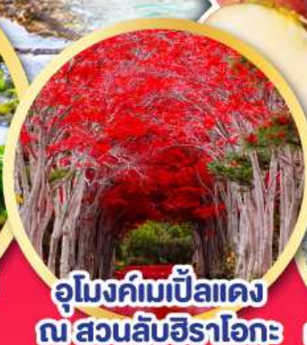
อุโมงค์ไม้แป้นแดง ณ สวนลับฮิราโอกะ