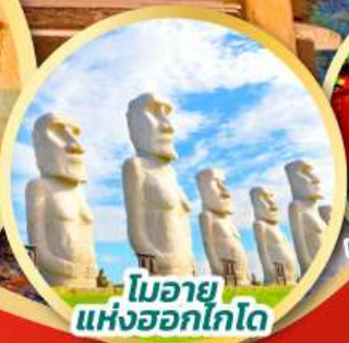
โมอาย แห่งฮอกไกโด