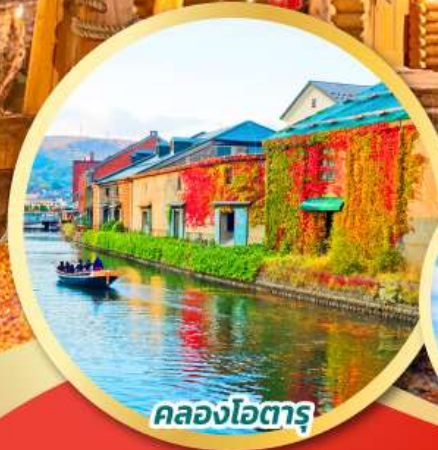
คลองโอตารุ