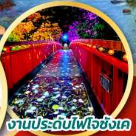
งานประดับไฟโจซังเค เริ่มต้น