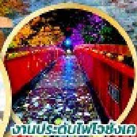
งานประดับไฟโงชิงค