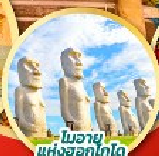
โมอาย แห่งออกโทโต