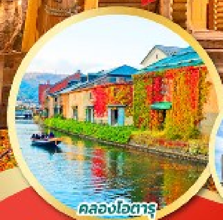
คลองโอตารุ