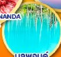
บลูพอนด์ (บ่อน้ำสีฟ้า)