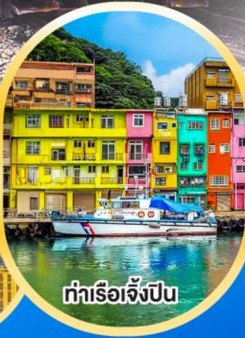
ท่าเรือเจิ้งปิน