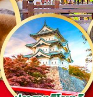
ปราสาทอิโรซากิ