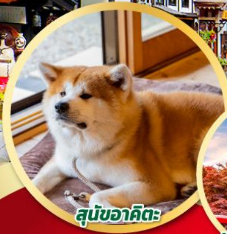
สุนัขอาคิตะ